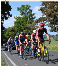
Cyklistický závod Tour de Zeleňák v Rumburku přilákal na start rekordní účast 800 účastníků.