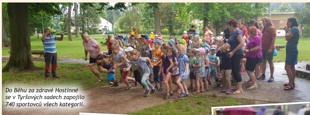
Do Běhu za zdravé Hostinné se v Tyršových sadech zapojilo 740 sportovců všech kategorií.