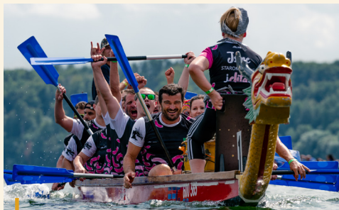
Do Festivalu dračích lodí na Slezské Hartě se zapojilo 32 dvaadvacetičlenných posádek.