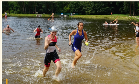
Hradecký terénní triatlon dokonale prověřil všestrannost všech 230 závodníků.

V průběhu letních prázdnin i září se po celé České republice naplno rozběhl projekt České unie sportu Tipsport Sportuj s námi. Z bohaté fotodokumentace od pořadatelů nabízíme obrazový pohled na některé zajímavé akce, které se v tomto období uskutečnily.