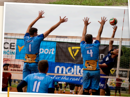
V pořadí 68. Volejbalová Dřevěnice dopadla po roční přestávce na výbornou - pod vysokou síť se představilo 172 týmů a 1 350 hráčů.