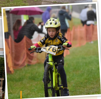
V rámci Velké ceny Vimperka horských kol se konaly také soutěže v dětských kategoriích.